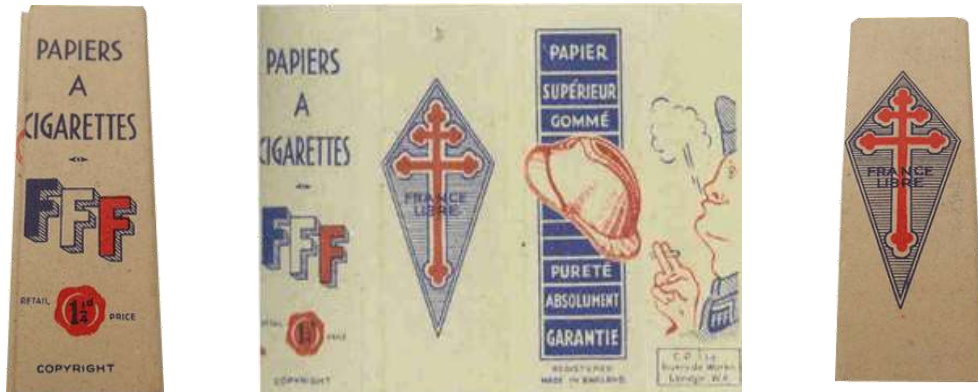
Carnet de papier à cigarettes fabriquer pour la France libre (Free French Forces) fabrication CP Ltd Riverside Works London W6. made in England.