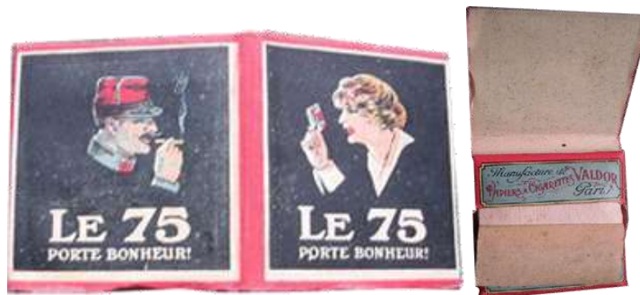
Papier " Le 75 " Manufacture VALDOR Paris