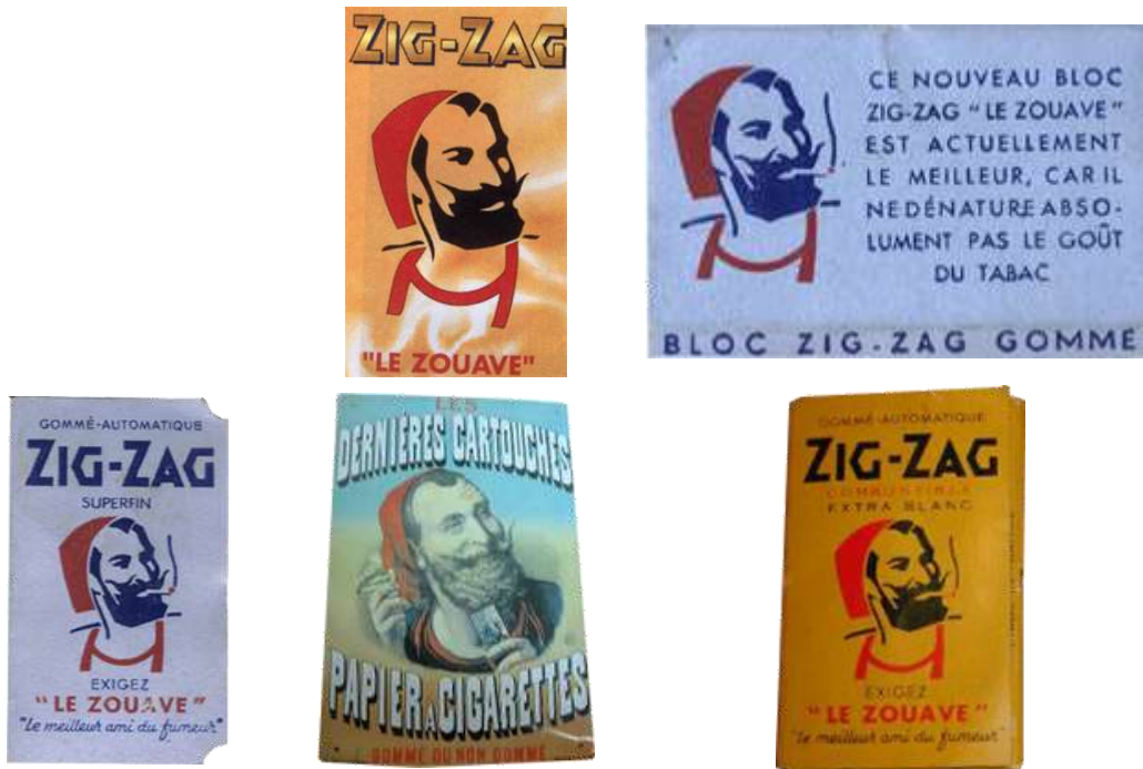
Papier à rouler "ZIG ZAG " Le Zouave